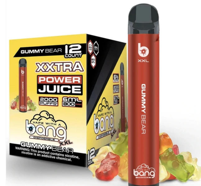
Bang XXL 2000 blossom 150 SEK